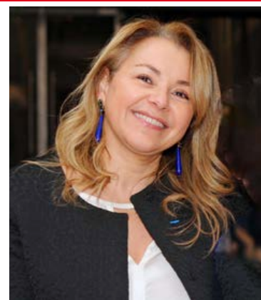
Fondatrice des Trophées Défis RSE

Car il n'y a pas de RSE sans preuve de Responsabilité, de Sens et d'Ethique.